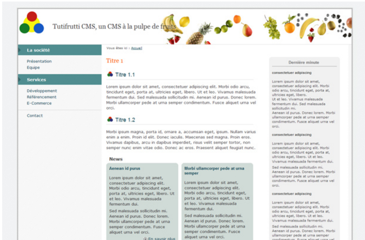
Design fluide, menu vertical dans une colonne gauche avec groupes de menus, dominante bleue.