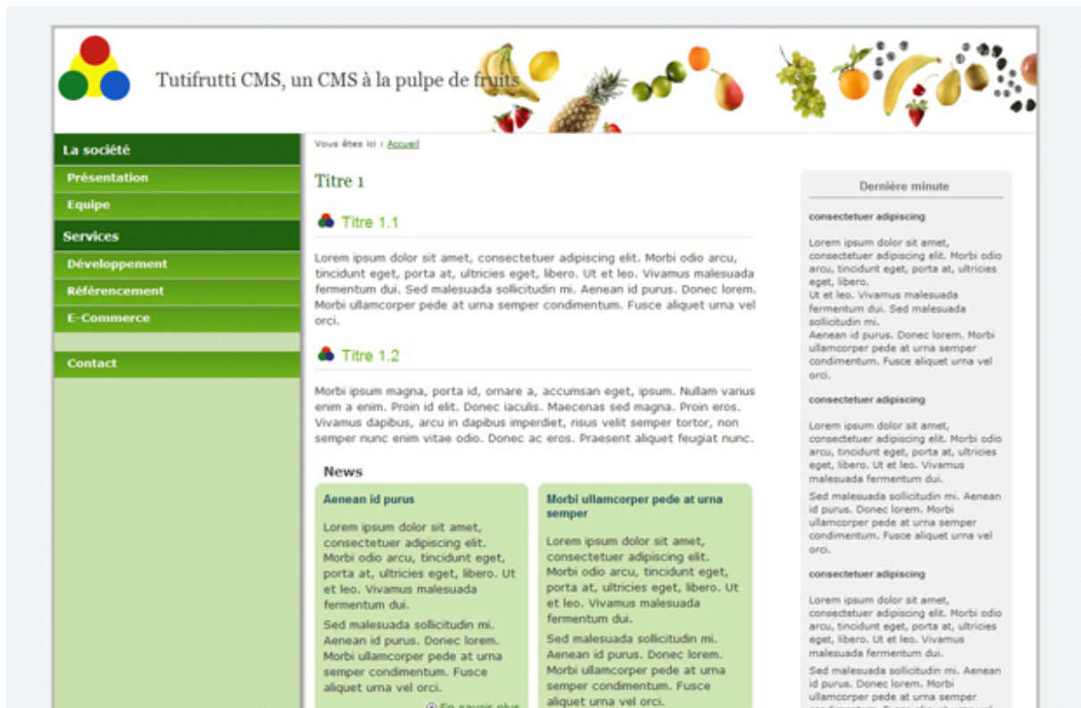
Design fluide, menu vertical dans une colonne gauche ombrée avec groupes de menus, dominante verte.